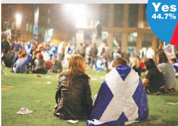
▼開票前，獨派支持者結束造勢活動後，在喬治廣場等待開票。

這次投票率高達百分之八十四點五九。選前民調顯示，六十歲以上的選民多半選擇維持現狀。蘇格蘭議會工黨成員馬里克認為：「許多六十歲以上的選民選擇維持現狀，是因為他們擁有大不列顛聯合王國強大幣值和護照，這讓他們有安全感，獨立只會削弱蘇格蘭勢力。」 工黨成員派特森表示：「我有來自英格蘭的家人和朋友，我也認同我的蘇格蘭身分。所有工黨成員都對保持現狀的結果感到開心。」