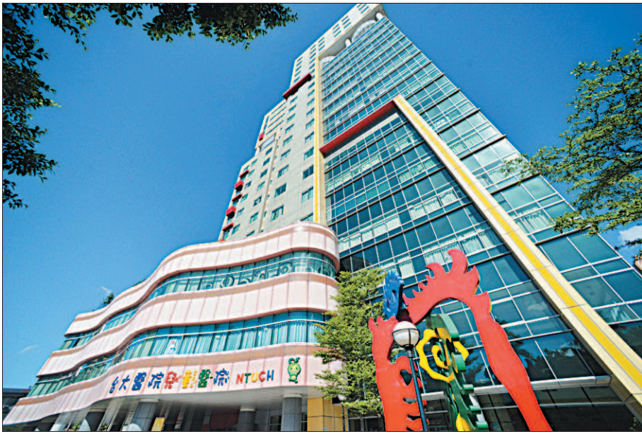
▲臺大醫院兒童醫院揭牌，為兒童提供友善的醫療環境，減少就醫時的恐懼。

吳欣恬、實習記者 戴郁珊 / 臺北報導 臺灣第一家兒童醫院昨天揭牌，八月一日正式營運。臺大醫院一九八四年五月就呼籲政府籌設兒童醫院，三十年後才真正實現。昨天多位臺灣兒童醫療的重要推手齊聚一堂，共同迎接歷史性的一刻。 衛生福利部今年四月公布第一波兒童醫