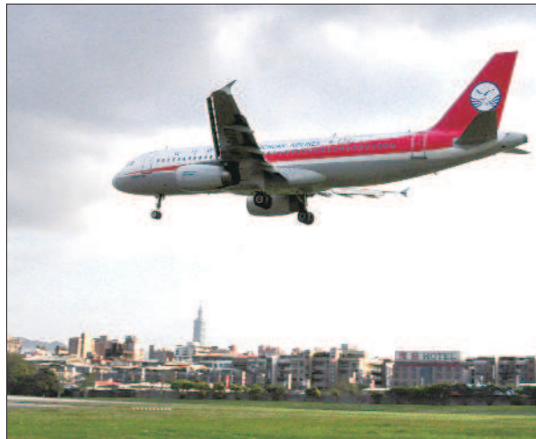
▲自從兩岸開放三通後，松山機場飛機起降頻繁，噪音干擾許多學校上課。