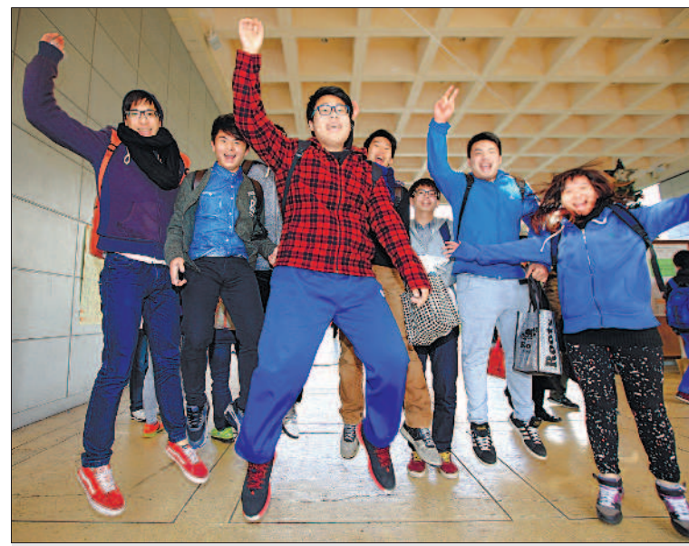
▲大學學測昨天結束，考生開心步出試場，迎接寒假和春節。

怕難以應付學測。住在雲林縣靠海偏鄉的新港藝術高中普通科吳彥霖，因為環境不允許，沒有參加任何補習，但他努力背單字，閱讀英文書籍，大量累積的單字終於派上用場，考完還算滿意。 高雄女中學生徐筱媛認為，作文題型偏向指考。她以身為衛生股長為例，因猶豫不決，使得工作無法達成預期成效，經由閱讀「領導能力是個選擇——克服恐懼，你也可以成為領導者」鞭策自己，行事要有魄力及效率。 相關新聞刊第2、15版