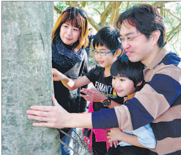
▲臺灣登山教育推展協會昨天在貴子坑舉辦「安全面山教育」健行活動，親子一起體驗如何在山林自保與自處。攝影/陳壁銘

陳韻晴 / 臺北報導 由臺灣登山教育推展協會主辦，國語日報社協辦的貴子坑「安全面山教育」親子健行活動，昨天在臺北市北投區貴子坑水