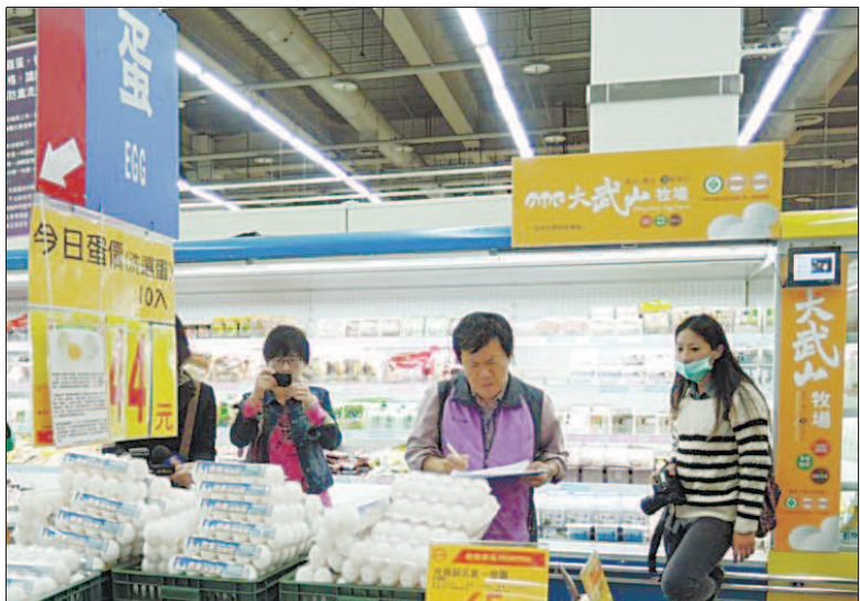
屏東縣衛生局針對大武山牧場蛋品的通路展開稽查。