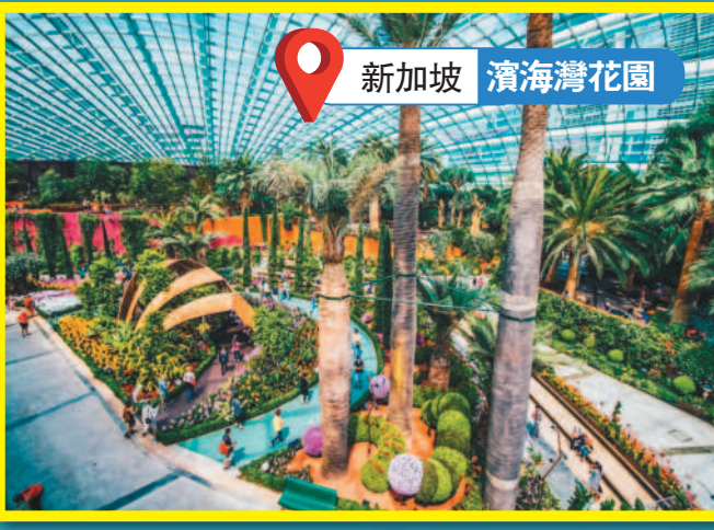
新加坡 濱海灣花園