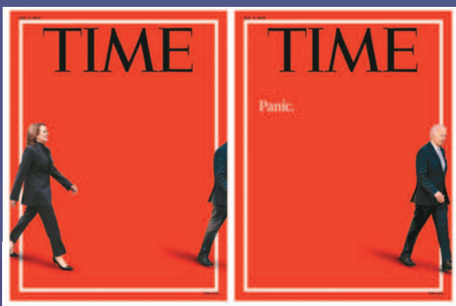
↑左圖爲美國《時代》周刊（TIME）7月21日出版的封面，當天總統拜登退出總統競選，圖中賀錦麗走入畫面；右圖封面爲6月28日（第一場總統辯論後的第2天）以數位方式發布，圖中拜登走向畫面邊緣，身後有「恐慌」（panic）字樣。

民調賀錦麗僅與川普相差1% 若出線美國總統大選 將是美國史上首位競選總統亞非裔女性