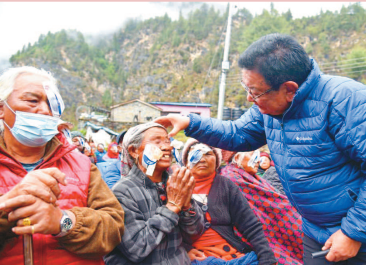
↑尼泊爾醫生魯伊特(右)已免費為13萬人進行白內障手術，被稱為拯救最多盲人的菩薩。→魯伊特(中)喜歡赤腳進行手術，因此被稱為「赤腳外科醫生」。