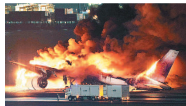
一架日本航空客機2日飛抵東京羽田機場，降落時與日本海上保安廳飛機相撞。圖／法新社

事故原因正由運輸安全委員會等相關主管機關調查中，塔台管制人員與兩機之間的對話等，仍在確認中。