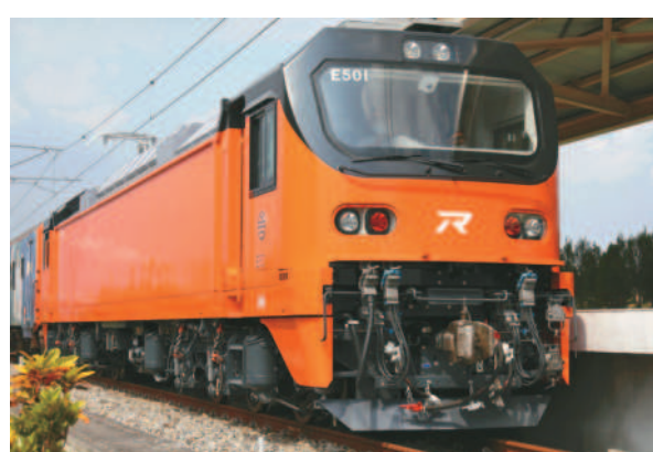
台鐵局昨天於潮州機廠展示全台首輛「E500型」電車，預計明年5月正式上路。

廠展示全台首輛「E500型」電車，該車設三合一緊急關閉、即時監控，具備單機牽引、雙機重連、推拉式等多功能，測試後逐步取代行駛25年以上老舊電車，明年5月正式上路。