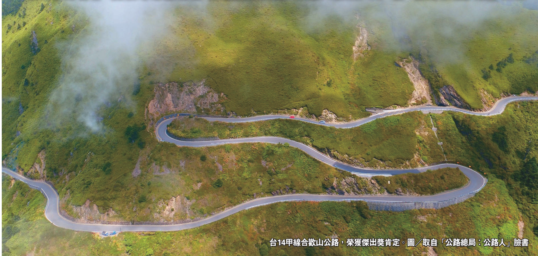
台14甲線合歡山公路，榮獲傑出獎肯定。

復育台灣百合、虎杖等原生植物 降低路殺風險 公路與自然共好 獲「台灣景觀大獎」肯定