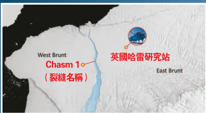
↑南極Chasm-1裂出來的冰山面積，約1550平方公里。圖為示意。