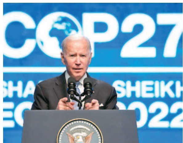
美國總統拜登11日在埃及夏姆錫克舉行的COP27發表演說，宣布美國減少甲烷排放，預估10年後比2020年減少30%。

今年全球二氧化碳排放量比去年多出1%，對於對抗氣候變遷可說是壞消息，然而卻出現反常的轉折，中國大陸的碳汙染比2021年降了0.9%，美國則比去年增加1.5%，兩者都與各自的長期趨勢相反；其中，大陸在2022年嚴格控制疫情的封控政策，是碳排放下滑的主因。