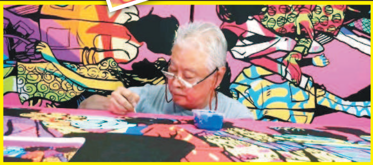
王澤讓老夫子跨出漫畫，走進視覺繽紛、普普藝術風格的畫作中。