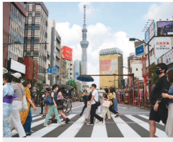
旅遊業者預估日本旅遊將大爆發，年底日本線業績可望恢復到疫情前3成左右。圖為東京晴空塔。

狀態。泰國已在6月23日取消口罩強制令，各種娛樂場所可恢復正常營業時間，民眾生活已回復到疫情前的模樣。