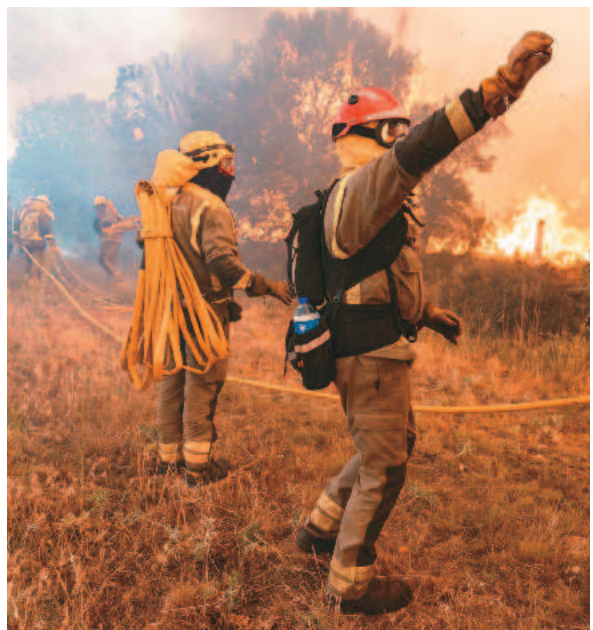
全球樹木遭野火摧毀的面積，是20年前的兩倍。圖為西班牙消防員，正在奮力對抗森林大火。