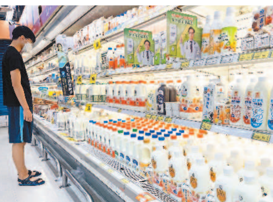
萬物齊漲蔓延到民生物資，若國內鮮乳都漲價，包含咖啡、手搖飲與烘焙點心、飯店等業者，成本壓力又會增加。 圖/資料照片

價格評議委員會」，再度邀集廠農雙方委員代表及學者專家共同研商，決議自6月至12月基礎乳價每公斤調漲2元，並將一年檢討一次機制修正為半年動態檢討一次。