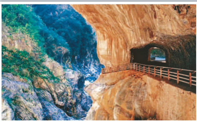
→台灣太魯閣中橫公路，每年都吸引不少觀光客。

【本報綜合外電報導】世界上有不少危險特殊公路，是在原本不可能穿越的地區，打造出讓偏鄉居民能夠連繫外界的通道。其中，中國大陸新疆尉犁縣至且末縣的沙漠公路，6月30日正式通車，成為大陸繼塔里木沙漠公路、阿和沙漠公路之後，第3條跨越「死亡之海」塔克拉瑪干沙漠的交通要道。