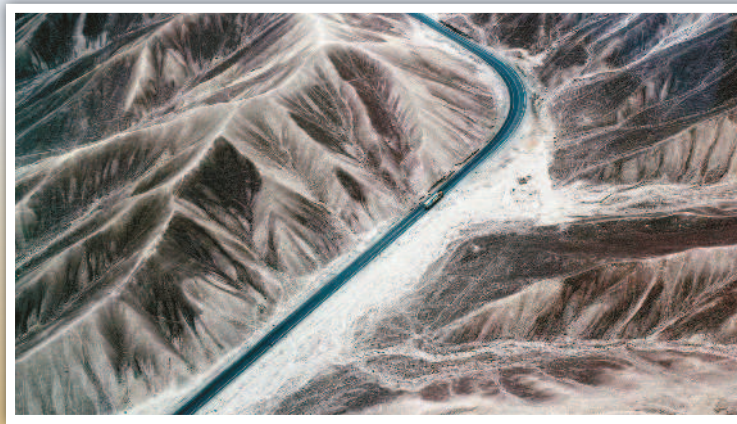
↑中國大陸新疆的沙漠公路，6月30日通車。