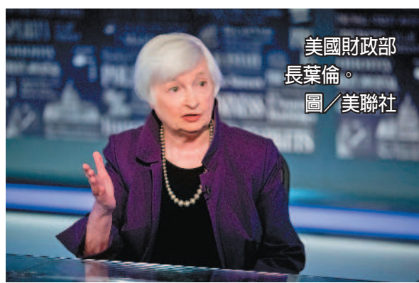
美國財政部長葉倫。

美國5月消費者物價指數（CPI）增幅年率達8.6%，這項衡量通膨情況的數字創40年來新高，顯示物價壓力衝擊經濟，也促使聯準會上周宣布升息3碼，為1994年來最大幅度。