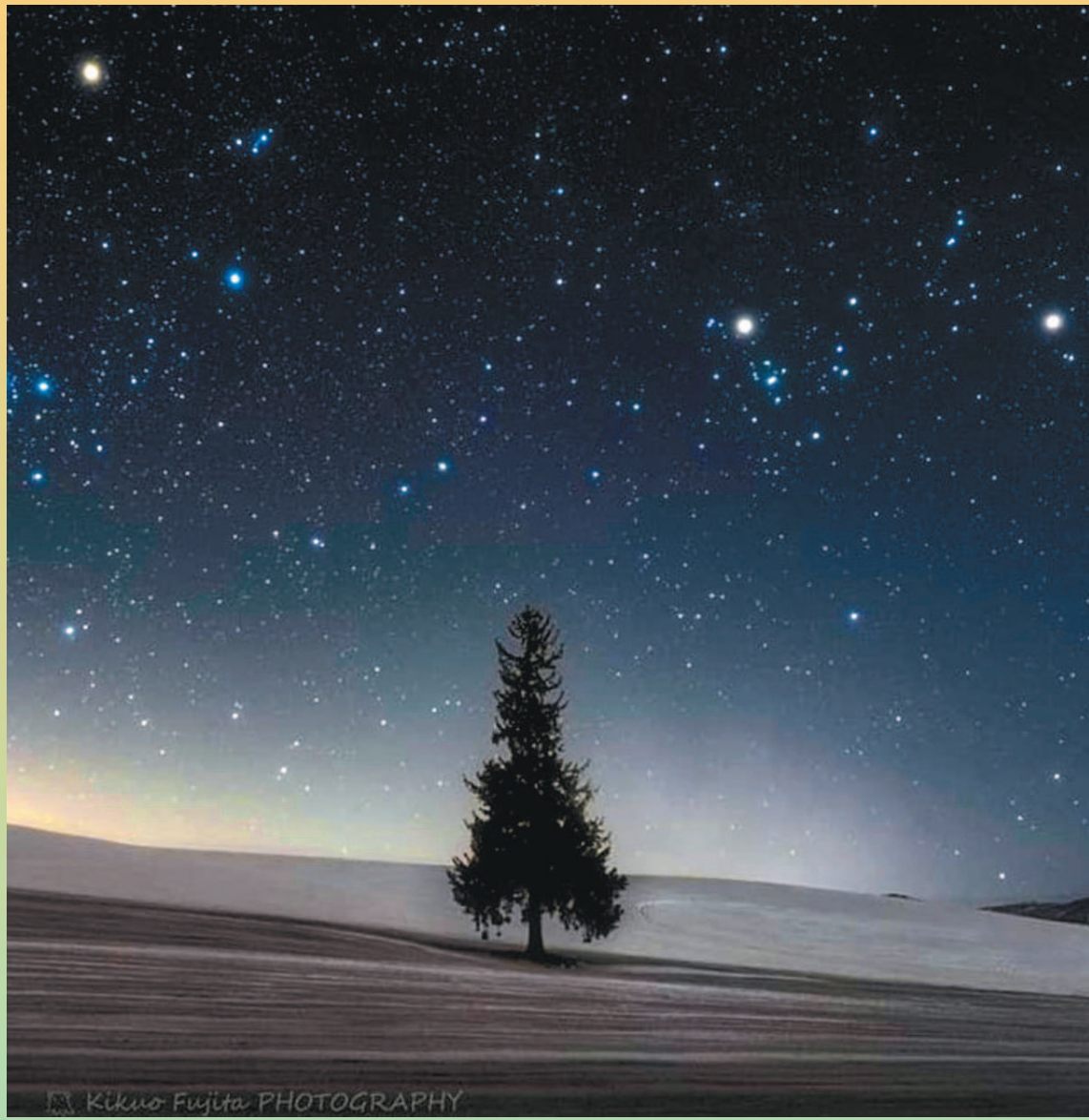
↑北海道美瑛町居民請電力公司移動電線桿、電線，讓遊客可以不用踩踏農田，就能拍攝網紅耶誕樹全景。