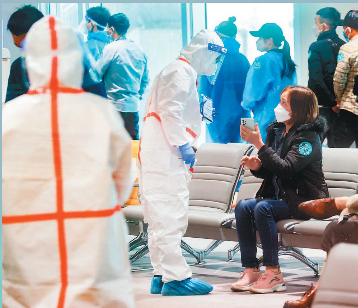
入境旅客下機後，於候機室內排隊等待進行落地PCR採檢，檢疫人員協助旅客填寫入境檢疫申報資料。