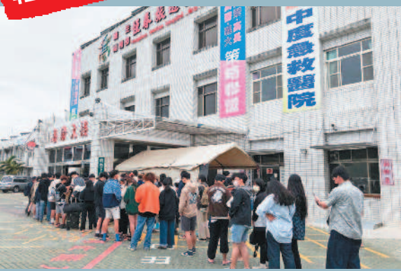
民眾從參加屏東縣「台灣祭」變成「採檢之旅」，在恆春旅遊醫院前等候PCR採檢。