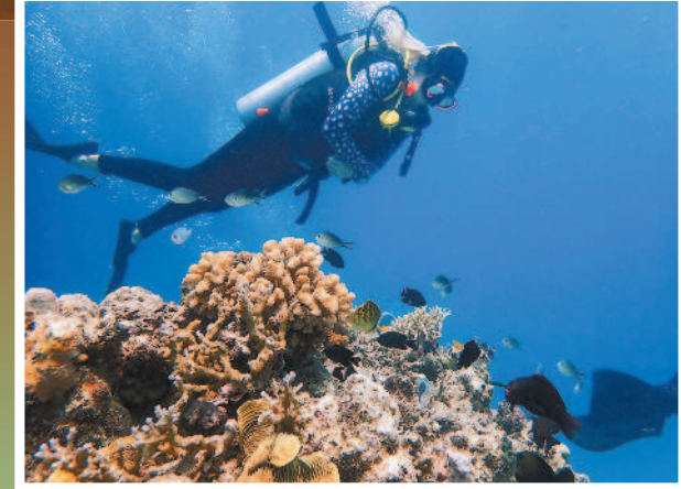
↑圖為大堡礁海域成群的小魚。