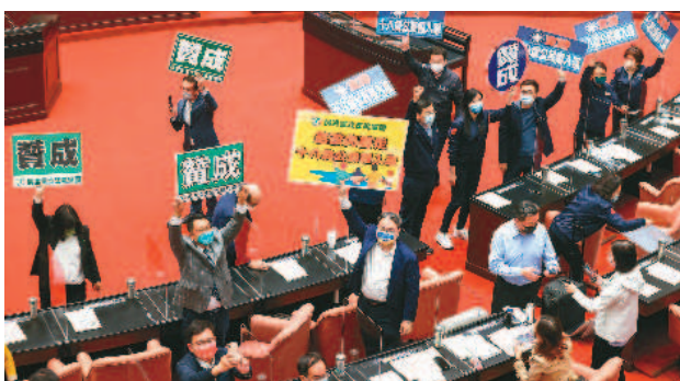
立法院昨天通過「18歲公民權」修憲案，109名出席的朝野立委全數投下同意票。

表決前，民進黨立法院黨團總召柯建銘，對國民黨主席朱立倫喊話「別當逃兵總司令」；多名時代力量、民眾黨及民進黨立委與青年團體穿上高中制服，呼籲朝野立委投下同意票。上百名高中生在立法院外靜坐「監票」。青年團體呼籲立委，若不給18歲年輕人投票權，2