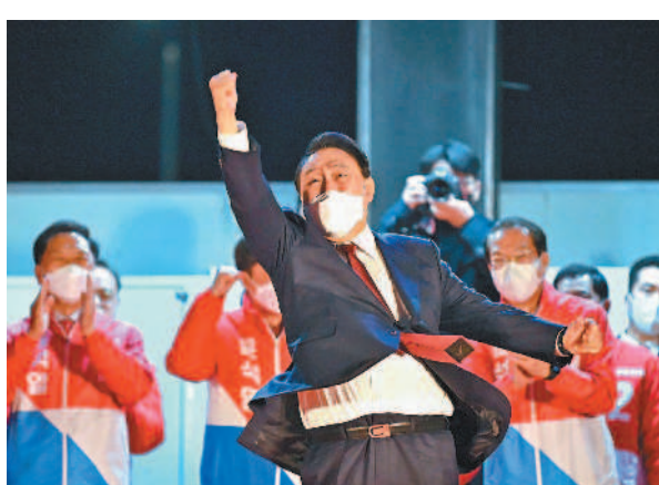
在野的尹錫悅贏得南韓總統大選，保守派力量重新掌權，預示南韓對中國大陸、北韓的態度將出現鷹派轉變。

由於尹錫悅是政治新人、外交新手，引發外界對他能否順利與共同民主黨占多數的國會達成合作、推動選戰政見的疑問。共同民主黨在國會300席裡占有大約180席，沒有他們的幫助，尹錫悅的總統任期最終可能成為「植物人」狀態，在2024年下屆國會改選前無法通過關鍵議案。