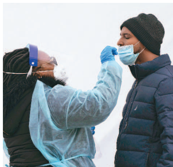
美國正在重訂防疫規範，將在一、兩個月內公布結束疫情「大流行」的全面性計畫。

【本報綜合外電報導】美國政府正在檢討所有新冠病毒的健康指引，白宮官員告訴英國《金融時報》，疾病管制與預防中心（CDC）正在重訂所有相關規範，從戴口罩指南到檢測規定等，將在一、兩個月內公布準備公布一項結束疫情「大流行」的全面性計畫。 這反映了白宮內部的看法，亦即 Omicron 變種新冠病毒的減弱，可能象徵著疫情最危險階段即將結束。與此同時，各項民調也顯示，美國民眾對持續實施的限制日漸感到厭煩，可能傷害民主黨在今年稍晚國會期中選舉的選情。 拜登政府的一名高級官員說：「我們現在所處的位置充滿希望和令人振奮。根據我們從初期受 Omicron 肆虐州所看到的一些感染和住院數據，非常令人鼓舞。」 美國的感染率在這個冬天稍早迅速攀升，但現在正在以同樣快的速度下降。據《金融時報》彙整的最新數據，在紐約日均病例數已從一個月前的約八萬五千例降至現在的六千多例。 這些數據使白宮更有本錢開制。