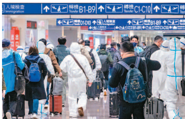
↑↓桃園機場昨天有2900多人入境，圖為桃園機場入境旅客。

Omicron疫情嚴峻，昨新增78名確定病例，其中72例是境外移入，指揮中心11日起實施長程航班需落地採檢，指揮官陳時中表示，前天機場共有9班次，是預期內入境最多的，總共檢驗700人，驗出陽性47人。不過圖表上標示，落地採檢確診為46人，因有1人為舊案，已經列有編碼，境外陽性率為6.77%，顯示境外落地採檢策略有效果。 此外，大規模疫苗接種搭配新冠口服抗病毒藥物，被視為終結疫情利器。衛福部食藥署昨宣布同意輝瑞新冠口服抗病毒藥物「Paxlovid」專案輸入，並採購2萬人份。