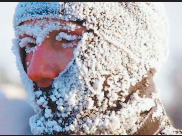
西伯利亞的奧伊米亞康非常寒冷。