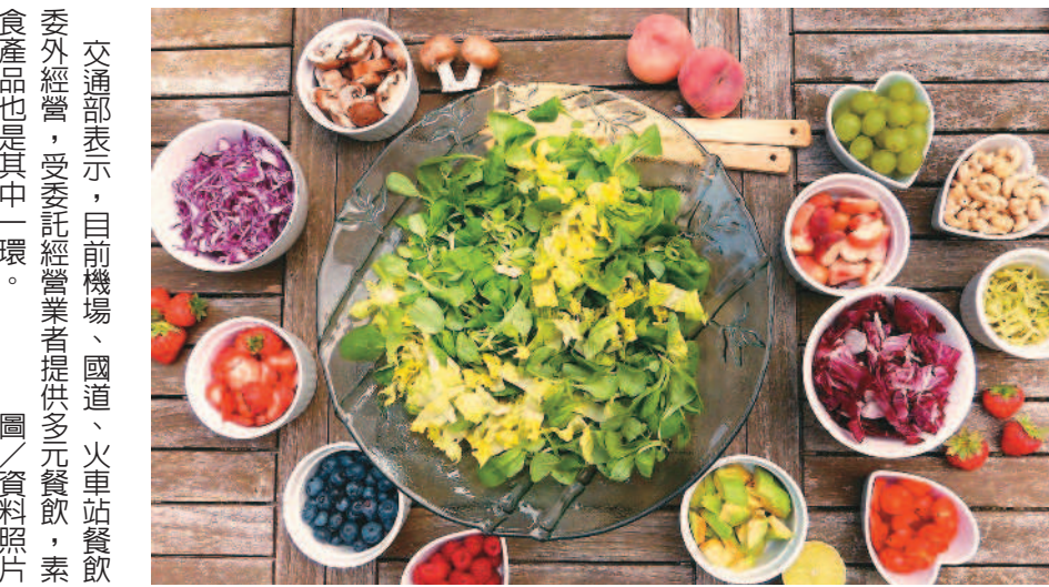
交通部表示，目前機場、國道、火車站餐飲委外經營，受委託經營業者提供多元餐飲，素食產品也是其中一環。