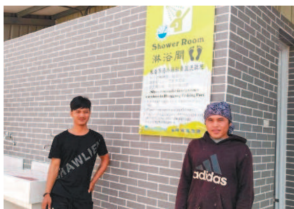
屏東東港首座外籍漁工公共淋浴間昨天啟用，讓外籍漁工可以舒服沖熱水澡。

【本報綜合報導】屏東東港首座外籍漁工公共淋浴間，昨天正式開放啟用。由漁業署補助、東港區漁會建置五間淋浴間，提供外籍漁工使用，讓外籍漁工舒服沖熱水澡，不必再像以往在廁所沖冷水。東港首座外籍漁工公共淋浴間，地點在東港漁港滿豐加油站、水傳尊王廟旁、櫻花蝦產銷班辦公室前方，原是產銷班兩側老舊洗手台，拆除整修成五間淋浴間，昨天啟用，並附設洗衣台、梳妝鏡，熱水供應時間每天早上九時至晚上九時。