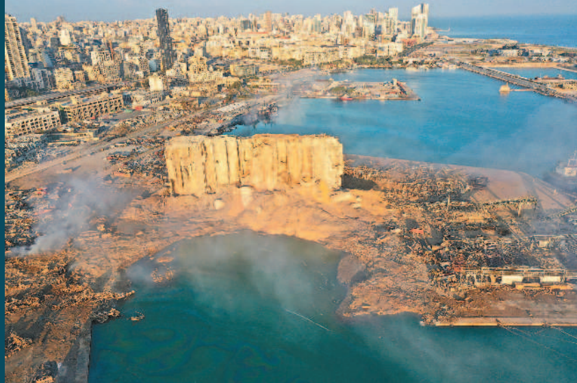
黎巴嫩貝魯特四日發生爆炸，港口被大火吞噬，房屋被炸毀，傷患湧入醫院，讓原本就因疫情而資源緊縮的醫院負荷更重。

一本報綜合外電報導，黎巴嫩首都貝魯特港區化學藥品倉庫四日傍晚發生兩起大爆炸，造成至少一百人死亡、逾四千人受傷。安全部門消息人士和媒體報導指出，爆炸是因倉庫的焊接作業引發。這場爆炸造成三十萬人無家可歸，對大半個城市造成破壞，損失估計超過三十億美元。 黎巴嫩總理狄亞布表示，貝魯特港口存放約二千七百五十公噸硝酸銨，引發這次爆炸，這些物質通常用來製作肥料和炸藥；他說這些化學物質未採取安全措施在倉庫存放六年，他誓言懲罰負責人員。他宣布五日為全國哀悼日。