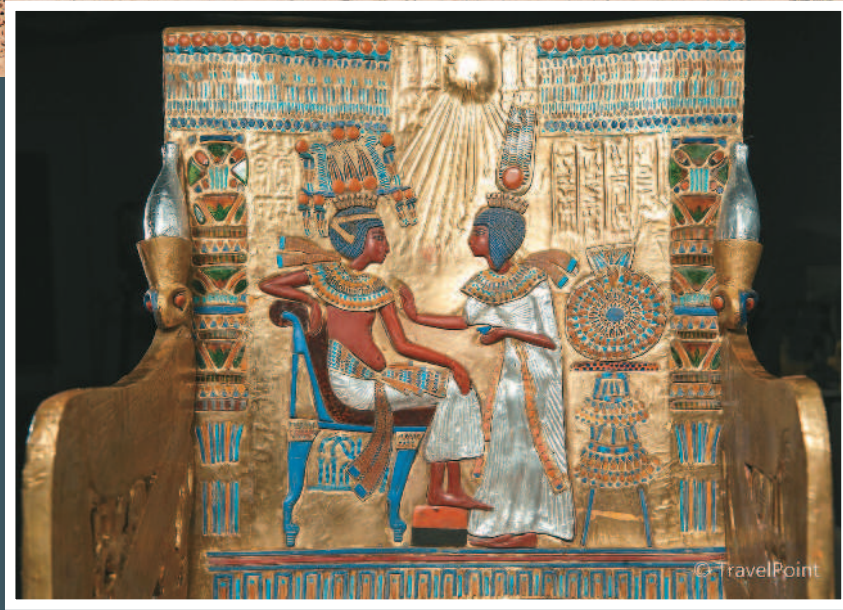
馬斯克(左上圖)推文說，金字塔為外星人所建。上圖為法老圖坦卡門的「國王座椅」等比展示藝品。

【本報綜合外電報導】英國廣播公司(BBC)報導，美國太空探索科技公司(SpaceX)創辦人馬斯克日前推文表示，金字塔為外星人所建，但埃及官員不認為外星人有任何功勞，埃及國際合作部一日邀請馬斯克拜訪埃及，見證金字塔並非外星人傑作。 馬斯克七月三十一日推文表示，「顯然，外星人建造了金字塔」。這則推文已被轉推超過八萬八千次，並引起埃及政府和專家注意。 埃及國際合作部部長艾瑪莎特(Rania al-Masrat)推文，邀請馬斯克和SpaceX來探索金字塔是如何建造的文獻，並來看看金字塔建造者的陵墓。她說，「馬斯克先生，我們等你」。 埃及考古學家哈瓦斯(Zahi Hawass)也透過影片，說馬斯克的論點是「全然的幻想」。 馬斯克隨後挖了一些資料，他推文說，「古夫金字塔曾是人類建造的最高建築，紀錄維持了三千八百八十年」。他附上英國廣播公司「金字塔建造者的私生活」文章連結，表示「這篇文章提供關於金字塔如何被建造的合理摘要」。 現存的金字塔有一百多座，最著名的是埃及吉薩金字塔群(Giza Pyramids)中高達一百三十七公尺的大金