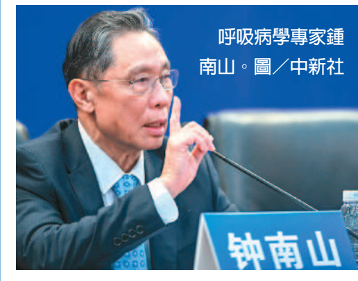
呼吸病學專家鍾南山。

經過近一個月治療，這名年輕男子已從加護病房轉至普通病房。他呼籲大家配合政府的要求，減少不必要的外出，「我體會到這並非只是個人的事，希望大家也能理解」。 鍾南山認為，防治疫情，從歷史來看，還是要靠疫苗。他以天花和脊髓灰質炎(小兒麻痺症)為例說明，兩者傳染性都很強，而且後遺症很多。他說：「我記得小時候，周圍有很多人臉上有麻子，這是得天花留下的後遺症。現在根本看不見了，靠的就是疫苗。我認為，研製新冠病毒疫苗非常迫切，必須要抓緊推進。」