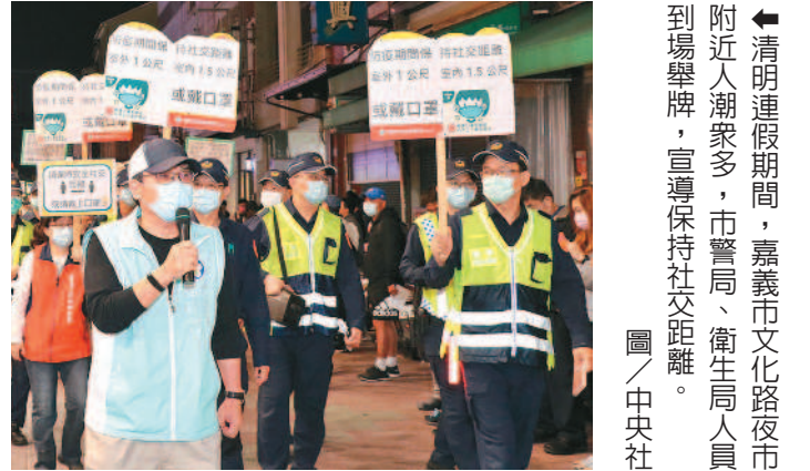
清明連假期間，嘉義市文化路夜市附近人潮眾多，市警局、衛生局人員到場舉牌，宣導保持社交距離。

國內昨日新增三例新冠病毒確診病例，全為境外移入，陳時中表示，確診者為一男、一女，年齡均二十多歲，入境日介於三月二十七日至三十日，發病日介於三月三十日至四月四日，出國目的為就學及探親，發現管道為居家檢疫兩例，及居家隔離一例。國內累計確診人數三百七十六人。「案三七六」搭乘的班機，目前已有十人染疫，此班機為三月三十日從美國紐約飛往台灣的華航CO112班機。