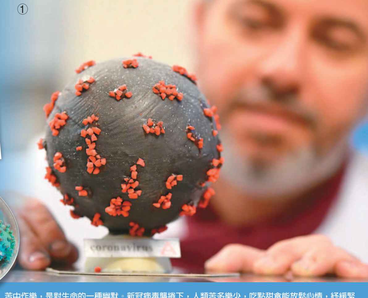
苦中作樂，是對生命的一種幽默。新冠病毒襲捲下，人類苦多樂少，吃點甜食能放鬆心情，紓緩緊繃情緒。許多國家的甜點師傅不約而同的以病毒來創作，如法國巧克力師傅普雷將牛奶巧克力塗黑，點綴紅色扁桃，創作出新冠病毒外型復活節彩蛋(圖①)。越南河內一名餐廳老闆展示新作「新冠病毒漢堡」(圖②)，德國糖果師傅洛斯用牛軋糖和杏仁糖，製作「新冠病毒抗體核果糖」(圖③)，發揮創意希望在疫情緊繃時刻，讓客人笑一笑。