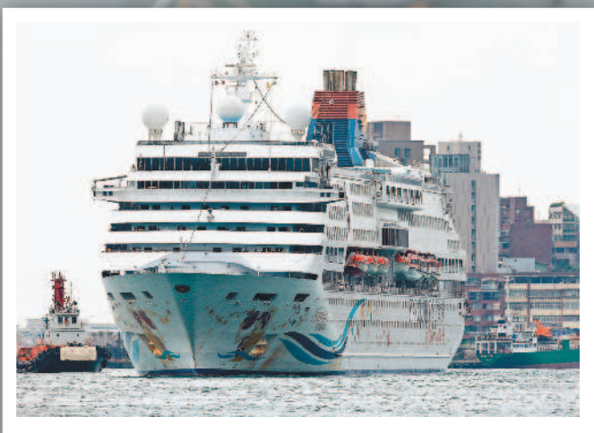
寶瓶星號昨天中午抵達母港基隆港後，消毒人員登船進行消毒工作。