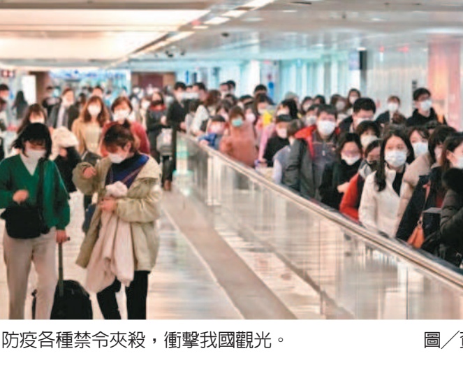
防疫各種禁令夾殺，衝擊我國觀光。

【本報台北訊】中央流行疫情指揮官陳時中六日宣布國際郵輪一律不得停靠台灣港口、大三通與小三通暫停等各種禁令夾殺，衝擊觀光。有學者說，只要守住，台灣八月將迎來旅客的大爆發。