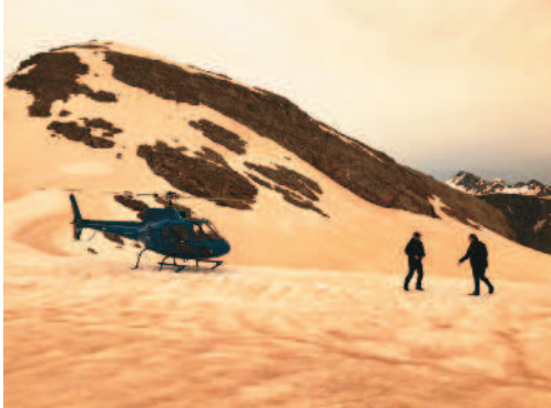
冰川被野火燒出來的沙塵覆蓋，讓人乍看之下以為是沙漠。

一名推特用戶貼了一張遠在澳洲二千里外的法蘭約瑟(Lanz Josef)冰川照，寫道：「法蘭約瑟冰川附近。這『裹上焦糖』的雪，是山林大火的沙塵造成。昨天它還是白的。」 澳洲持續高溫和乾旱加劇野火火勢，許多人指出氣候變遷是讓野火惡化的因素。目前僅新南威爾斯省就有九百多間房屋被推毀。 即使加拿大和美國都出手相助，但仍無法控制火勢，至今已燒掉一點五個台灣大小的面積。 當地生態也面臨浩劫，雪梨大學的生態專家估計，有將近五億隻動物喪命。野生動物專家則估計，至少有八千隻無尾熊因為這場野火災情而喪命，是新南威爾斯省無尾熊數量的三分之一。