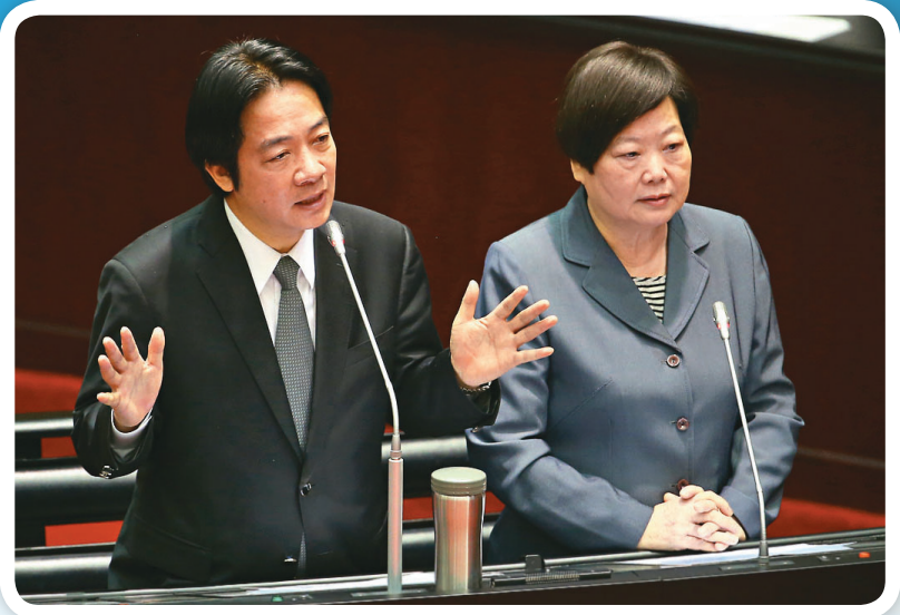
行政院長賴清德(左)昨天在立院備詢時表示,修法不會獨厚勞資哪一方。右為勞動部長林美珠。

【本報綜合報導】勞動部昨天宣布《勞基法》修法預告草案,包括把休息日加班費的一例一休刪除,工時工資核實計算、特休假可遞延一年、放寬加班工時上限、勞工最多可連上十二天班、放寬輪班間隔十一小時規定等。行政院長賴清德表示,這次修法是增加企業與勞工彈性,不會獨厚哪一方。 一例一休上路以來引發許多爭議,勞動部昨天正式對外預告《勞動基準法》修法草案,將從五大方向著手。 勞動部主任秘書陳明仁昨天下午臨時召開記者會,宣布五大修法方向:一、休息日出勤的工時及工資計算,改依勞工實際出勤時間計算,仍計入每月加班時數上限。 二、每月加班工時時數部分有兩案,甲案為將一個月加班時數上限放寬為五十四小時;乙案是加班時數以三個月為周期,單月可運用的加班時數上限放寬為五十四小時,三個月內不得超過一百三十八小時。但兩案都須經過工會同意或勞資會議同意。 三、輪班制勞工的間隔時間也分為兩案,