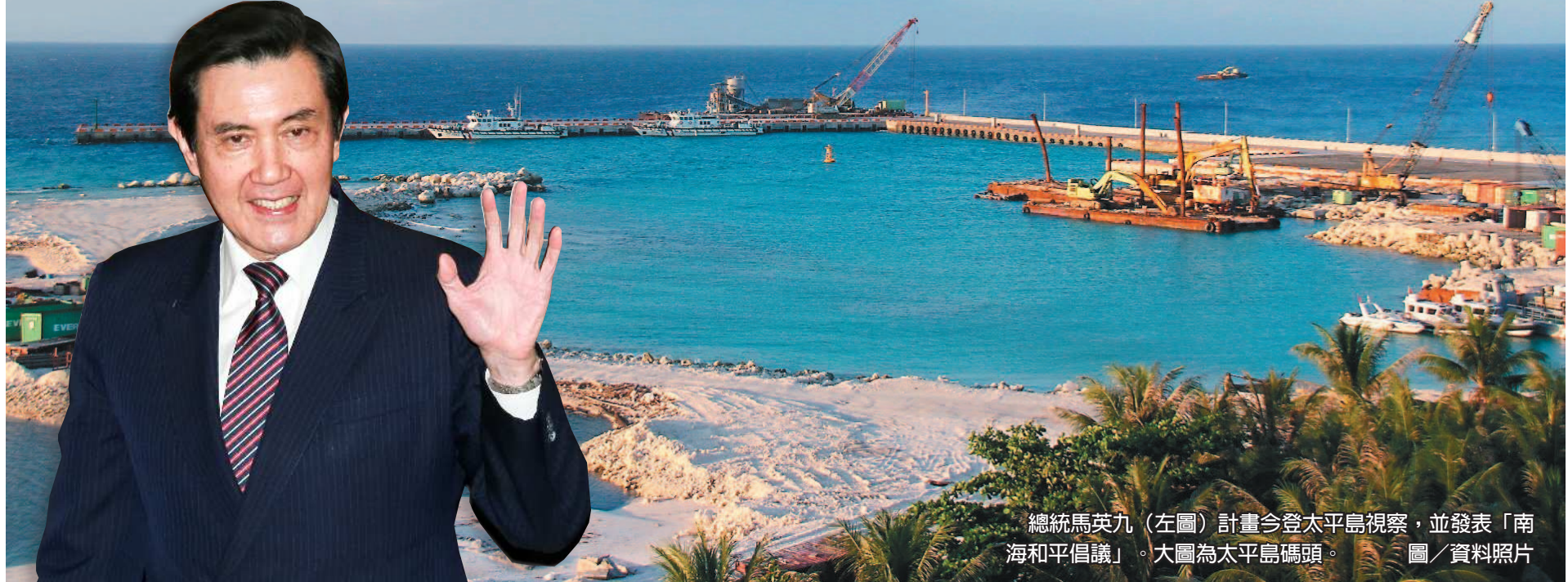
總統馬英九（左圖）計畫今登太平島視察，並發表「南海和平倡議」。大圖為太平島碼頭。