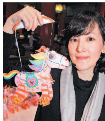
台灣燈會小提燈由設計師林佳菁設計(左圖)，命名為「超萌馬」。主燈「龍駒騰躍」取材自馬者馬。(下圖)