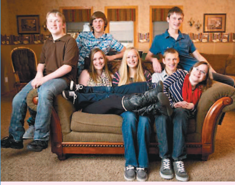
七胞胎剛出生時(下圖)登上了國際新聞頭條，現在他們已經十六歲了(上圖)。