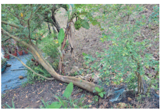
您看過尾樹嗎？高山農場「頭尾皆生」的白臘樹，連園藝專家都嘖嘖稱奇，直呼：「太稀有，幾乎沒有見過樹倒了還會生長。」

飛天自行車使用生物燃料，最高可飛到一千兩百一十九公尺高，飛行速度每小時最快可達二十五英里；裝滿燃料後，自行車最多可飛行三小時。