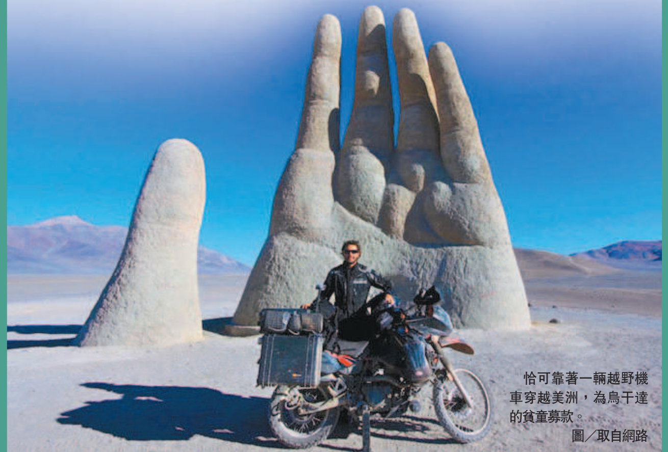
恰可靠著一輛越野機車穿越美洲，為烏干達的貧童募款。