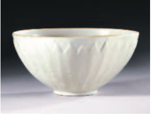
三美元買來的宋朝陶碗，最後高價賣出。

四位買家在拍賣會上對這只罕見的宋朝陶碗激烈競標，最後由倫敦著名藝術品經銷商古斯朋·埃斯凱納齊(Giuseppe Eckenazi)以兩百二十二萬五千元得標。