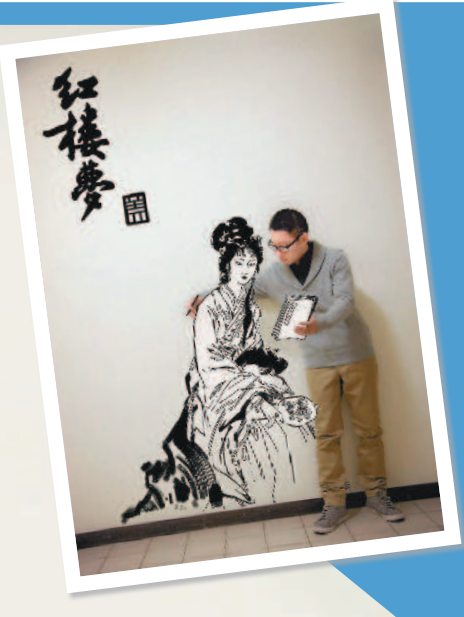
蓋括用手繪及攝影的方式，穿越哆啦A夢的任意門。