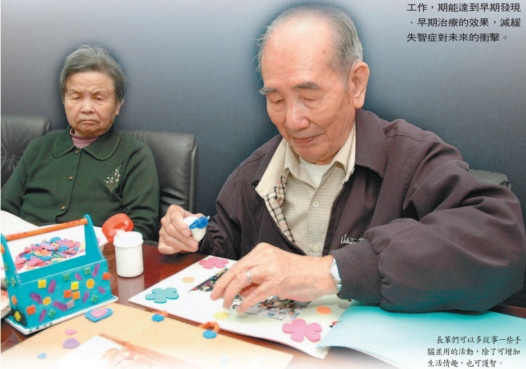
長輩們可以多從事一些手腦並用的活動，除了可增加生活情趣，也可護智。

台灣已經邁入高齡化社會，除了一些常見的慢性疾病之外，平均餘命的增加，也使得老年失智症成為愈來愈重要的公共衛生議題。