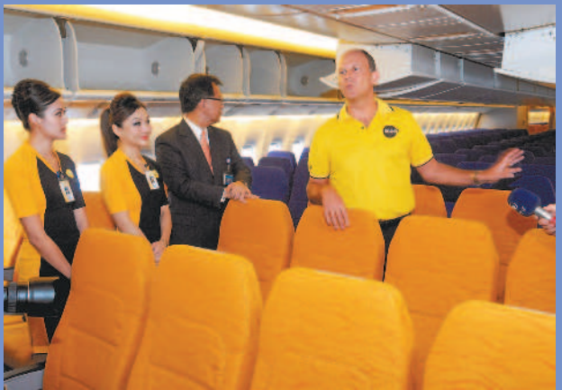
新加坡酷航以波音777大型客機載客，宣告廉價航空進入戰國時代。