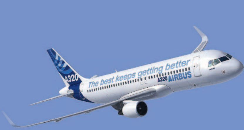
A320空中巴士是常見的廉價航空機型。