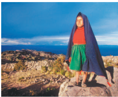
呂艷芳拍攝的《工作中的印度婦女》。此張作品榮獲台中市大墩美展二〇〇七年攝影類第一名。

《西藏阿里》作品，是呂艷芳初學攝影幾個月時拍攝的，老師驚訝於她在攝影方面的天賦。