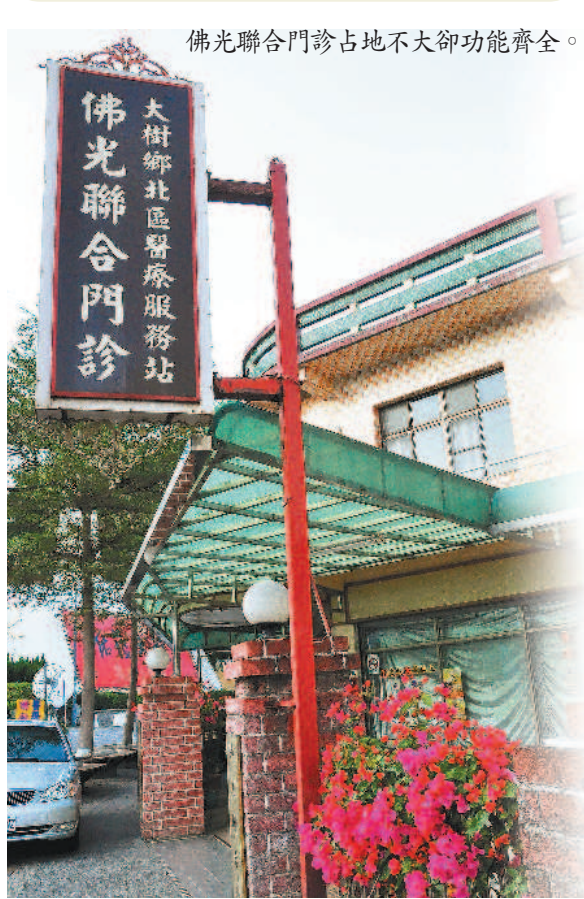
佛光聯合門診占地不大卻功能齊全。