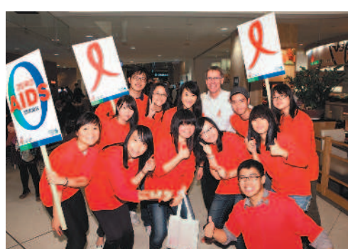
「讓愛滋歸零」，總計發出超過1500個紅絲帶。

一九八五年在台灣成立第一家分行，並自二〇〇四年起，為幫助罹患眼疾的孩童重見光明，協助募款超過2000萬元，對外除舉辦視障運動會，還教導視障生金融理財、體驗臨櫃、操作ATM點字版；贊助視障閱讀、淨灘、號召義工關懷愛滋患者等活動，對內則促進視障就業、舉辦拯救地球一小時和節水等環保競賽。有關渣打最新贊助的公益路跑詳情，可洽詢中華民國路跑協會，活動專線：(02) 2585-5659。