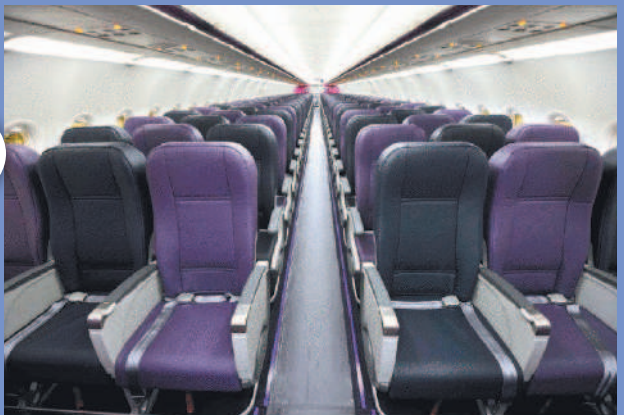
廉價航空多半採單走道，空間也比一般航空公司的小。

文／Andy 春節以來，有關廉價航空「出包」的新聞再三發生，但對大多數喜歡出國旅遊的國人而言，究竟什麼是「廉價航空」？什麼情況下使用最划算？國人仍不甚了解，以下且就本人多年來從事相關行業及陪愛旅行的經驗，為讀者分析一二。 廉航紛紛來台搶市 多年來，航空公司、旅遊業者競相促銷，教會不少消費者對於出國盤纏更加精打細算！這其中，占旅費支出最大宗、最難省的機票價格，也隨各國廉價航空公司陸續來台搶市，產生許多新的變數！ 說起來，廉價航空並不是什麼新鮮事，歐陸、美洲因為國國相連，除了火車，最速而廉的代步工具便是廉價航空；此外，孤懸於南太平洋的澳洲，因為洲際往來需求殷切，也成為廉價航空發展興盛的地區。航業也有一說，認為廉價航空在全球發展已成趨勢，受歡迎的效應早已銳不可擋。 兩岸航運最具潛力 據資料顯示，二〇〇四年澳洲捷星航空，在新加坡成立捷星亞洲航空對飛台灣及新加坡，是第一家來台開闢關土的國外廉價航空。截至去年底止，台灣已有十一家廉價航空，包括：澳洲捷星航空、韓國釜山航空及真航空、Tway（德威航空）、EVA（易斯達航空）、新加坡亞航X、馬來西亞亞航及子公司亞航X、菲律賓宿霧航空、新加坡酷航、日本樂桃航空。民航局認為，台灣廉價航空的市場占有率目前僅有3%，仍處於萌芽階段，未來還有很大的發展空間，政府及消費者也樂見其成。特別是兩岸直飛航班，目前幾乎班班客滿，遇到假日更是一位難求，未來若有台資超過五成一的國人自營廉價航空成立，光是搶進兩岸航空市場，大餅就吃不完。 看好市場眾眾競逐 雖然廉價航空快速增加，傳統航空公司如華航、長榮等，認為彼此客源不同，好比飯店有各種等級，低價雖有吸引力，但多數旅客仍希望能有舒適的旅遊，所以廉價航空絕不可能取代傳統航空公司。話雖如此，但事實上，眼見廉航市場可為，華航已計畫將旗下的華信航空轉為廉價航空，復興航空也在考慮跟進。此外，另有國內財團計畫與國外航空公司合資成立廉航公司，顯見未來廉航與傳統航空