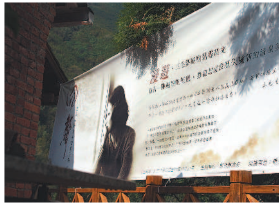
緬懷三毛當年倚窗冥思的大型海報。