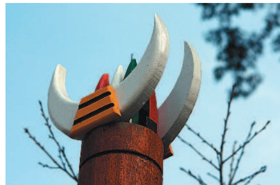
看到原住民圖騰，宣告原鄉已在眼前。

陽光透過彩繪玻璃，灑在聖像和壁畫上，使得小小的教堂，更顯莊嚴神聖。 出了教堂，旁邊的運動場上，又是另一幅跳躍歡騰的景觀。一群孩童，雙手忙扯鈴，吆喝著較量功夫；另一端則聚集了十幾個女孩，正在練習張學良紀念館開幕式的舞蹈表演，手上敲打著竹節，熱力歡舞，明快的節奏，舞出了原住民飛揚的青春活力。 籃球場上有幾個孩子奮力投籃，旁邊的山壁上，畫滿了聖經故事，鮮豔生動的圖像，跟場上躍動的身影，形成一虛一實的有趣對比。面對這活力四射的場景，大夥猛按快門，直拍到飢腸轆轆，才心滿意足地收工下山。 清泉一日遊，既享清幽又快活拍攝，真是收穫滿行囊。