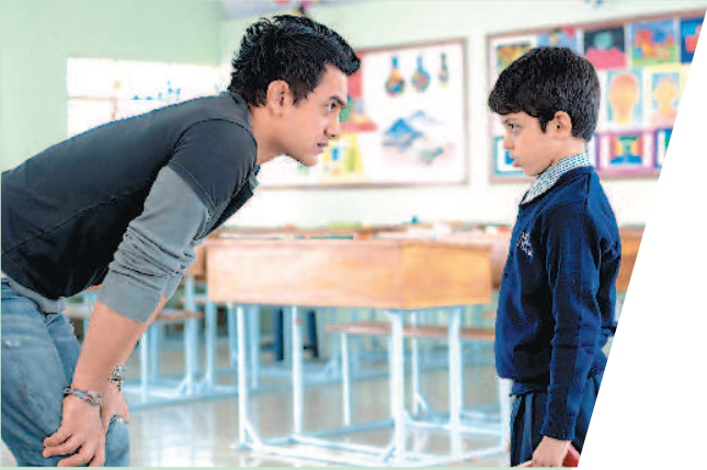
▲阿米爾罕自製自導自演的《心中的小星星》劇照。 ▲阿米爾罕與妻子可蘭拉奧很登對。