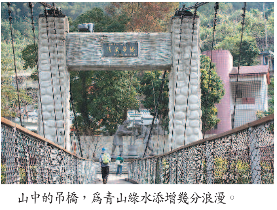
山中的吊橋，為青山綠水添增幾分浪漫。

一個周末假日，我們夫妻帶著小兒子小波跟著老師驅車去探訪清泉——位於新竹縣五峰鄉，是泰雅族和賽夏族聚居的部落。 從高速公路下來，穿過竹東熱鬧的市區，往山中行去。繞過一山又一山，沿途景色也愈來愈幽靜，通過古老的桃山隧道，再拐幾個彎後，眼前豁然開朗，終於來到這個清幽祕境——清泉。 三座吊橋添浪漫 清泉風景區內有三座古老的吊橋，騰空橫跨上坪溪，早期是來往山間的主要橋梁，公路開發後則成為美麗的觀光景致，嬌媚的身影，給壯麗的山水增添幾分浪漫溫柔。 吊橋邊，幾輛發財車上擺著紅澄澄的柿子，一群住民熱情地推銷當季的特產。 溫泉山莊和咖啡館醒目的招牌，在岸邊向遊客招手。這裡的水質清澈屬弱酸性碳酸泉，無色無味。 清泉，不但擁有幽美的山水和滑溜的溫泉，更因為張學良、丁松青和三毛等人曾在此居住而留下引人幽思的人文歷史。 前人已遠空留思 民國大將領張學良，因西安事變而被蔣介石軟禁在此，抑鬱以終。早期的居處，被洪水沖毀了，官方在停車場邊建立一座紀念館，以供世人憑吊，一群工人為即將到來的開幕典禮，賣力趕工。 走過吊橋，順著斜坡往上走，來到「三毛之家」，紅磚造的房子，大門深鎖。屋前高懸的大型海報上，有張三毛倚窗冥想的照片，醞釀