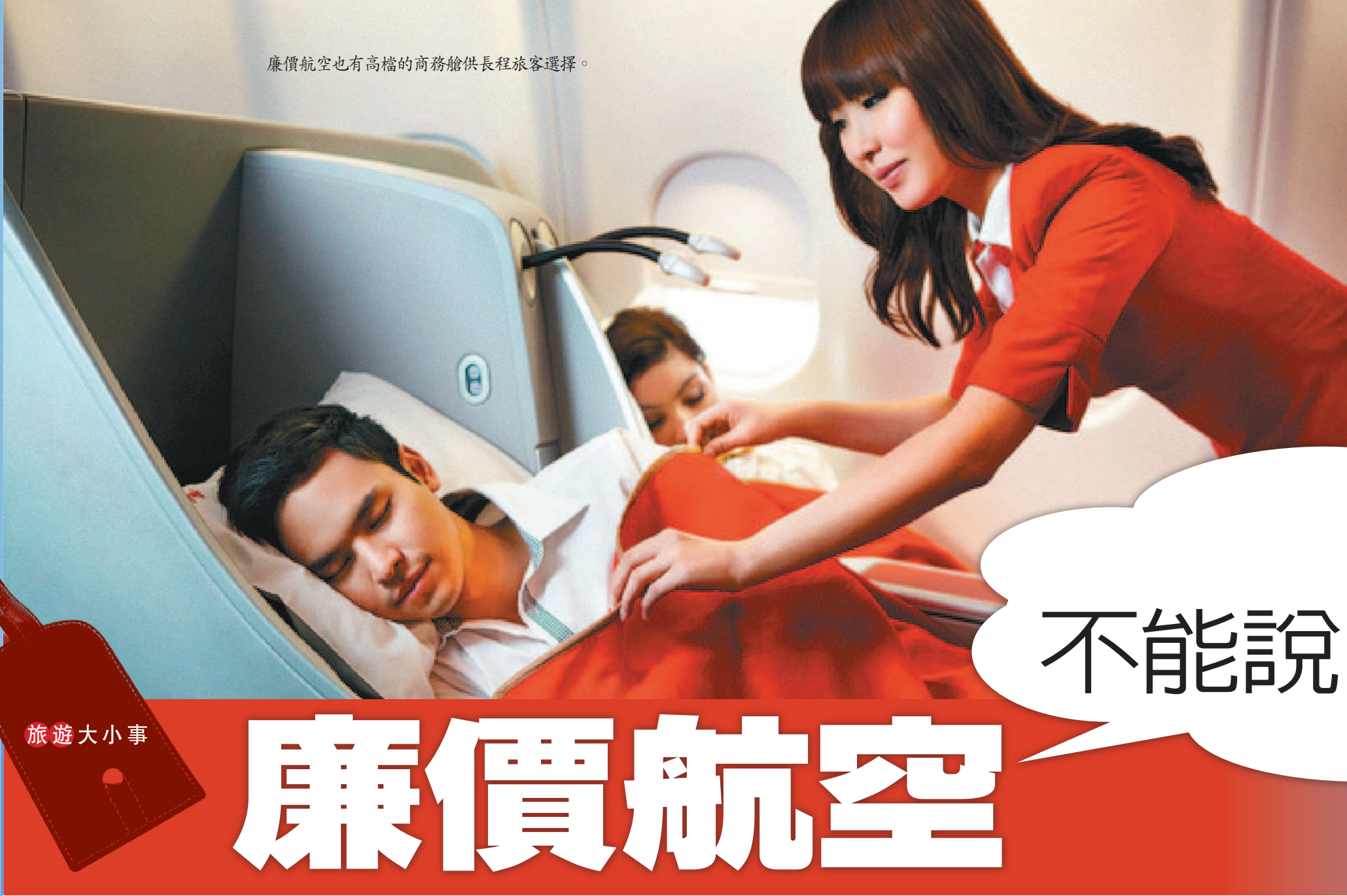
廉價航空也有高檔的商務艙供長程旅客選擇。

景點：左鎮遊憩系統以當地草山月世界獨特的青灰岩地質，以及平埔族遺跡的榮寮溪石棺，吸引遊客尋幽探源。 虎頭埤遊憩系統則以虎頭埤水庫風景區為主，區內還有虎溪釣月、水橋紅影等八大美景，並設有高爾夫球場，以及兼具休閒、觀光與生態資源的休閒農場，如走馬瀨農場、九層嶺休閒農場，讓遊客能盡情在大自然中，享受泡湯、採果、品嚐咖啡的樂趣。 搭配本活動，交通部並推出《西拉雅健康樂活遊》一書，讓銀髮族可以當作規畫旅程的參考，歡迎民衆相約樂活遊西拉雅。