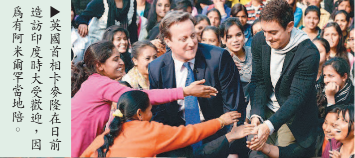
▲英國首相卡麥隆在日前造訪印度時大受歡迎，因為有阿米爾罕當地陪同。