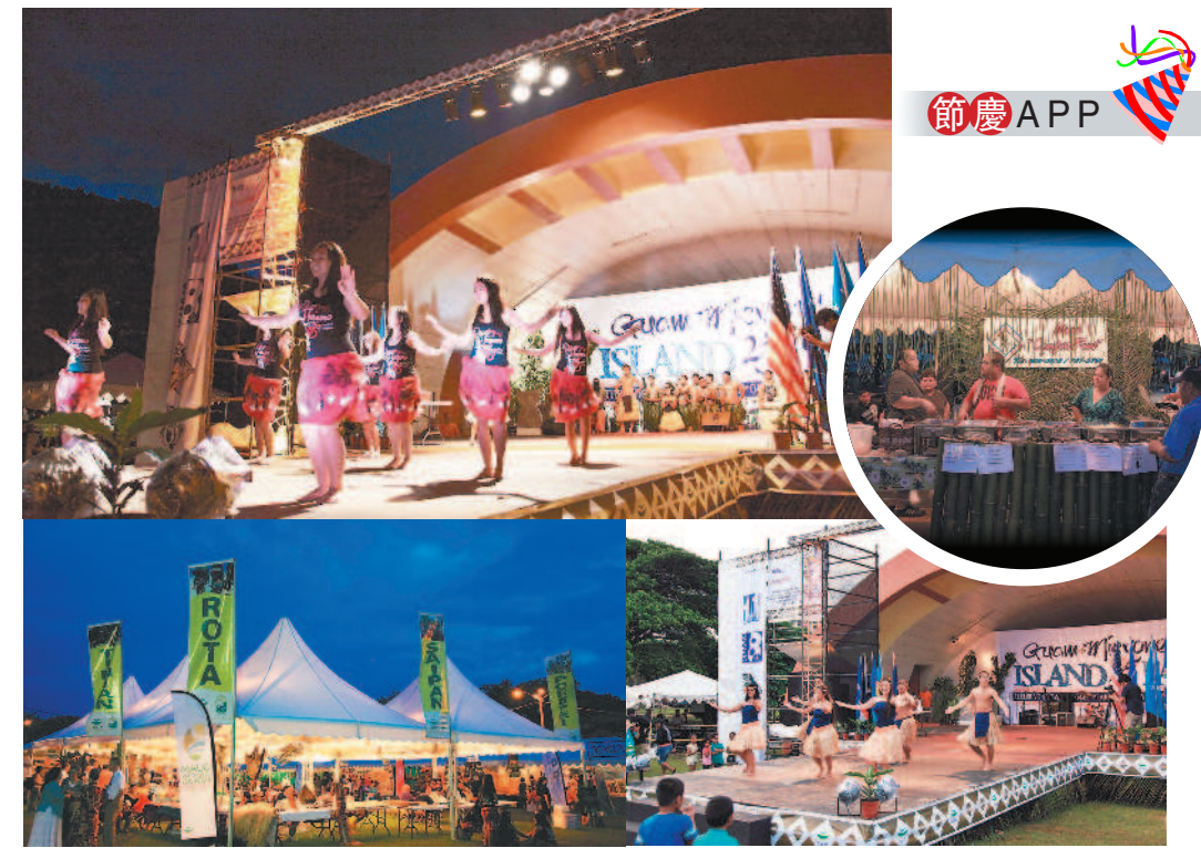
關島密克羅尼西亞島嶼嘉年華是體驗當地文化與藝術的最佳途徑。