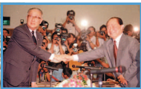
一九九三年四月二十七日，海基會董事長辜振甫（左）、海協會會長汪道涵在新加坡展開兩岸會談，留下歷史畫面。圖／資料照片

【本報綜合報導】二十年前的今天，也就是一九九三年四月二十七日，新加坡飄著春雨，海皇大廈周圍警方重重封鎖戒備