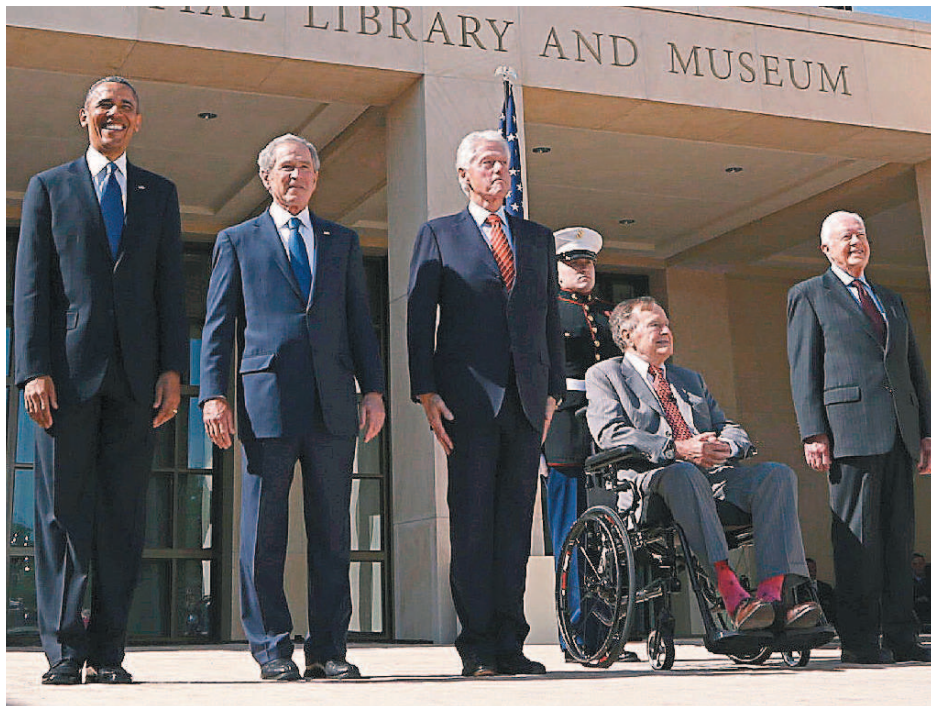
五位現任、前任美國總統及第一夫人二十五日聚集一堂，出席前總統布希紀念圖書館及博物館落成典禮，左圖左起為歐巴馬、小布希、柯林頓、老布希（坐輪椅者）、卡特。右圖為蜜雪兒、歐巴馬（左起）和蘿拉、布希、希拉蕊、柯林頓、芭芭拉、布希、羅莎琳、卡特。