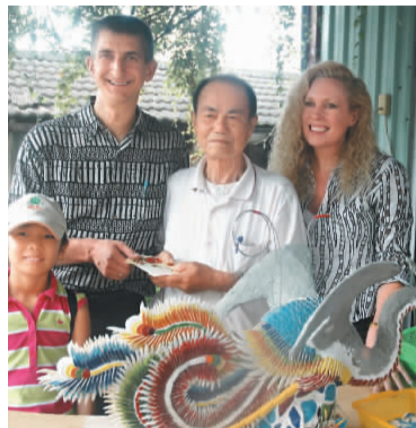
保羅夫婦帶養女認識台灣文化。

【本報綜合外電報導】蘇格蘭研究人員發現，倭黑猩猩會發出不同的聲音，像是美食專家一樣告訴同伴：「這個好吃，快來。」或是「這個還好，普普通通」。 蘇格蘭聖安德魯斯大學的研究人員指出，當倭黑猩猩遇到食物時，會發出咕噥聲，告訴同伴「食物在這」，不過研究人員將猩猩所發出的聲音錄製下來更進一步研究後發現，牠們發出的聲音會依不同食物而有所改變。例如牠們遇到奇異果與蘋果會發出不同的聲音。 偏好奇異果的倭黑猩猩會發出音調較高的長吼（興奮的聲音），不過對於不怎麼喜歡的蘋果，牠們則是發出低吠聲。