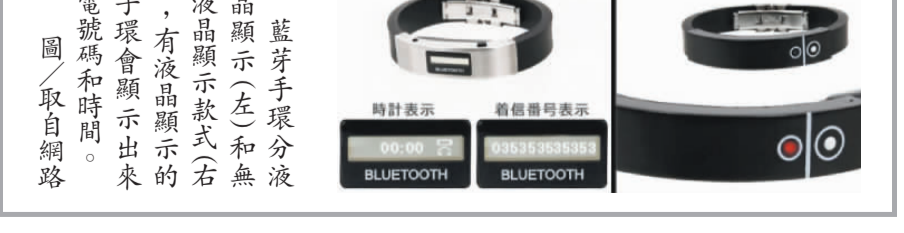
藍芽手環分液晶顯示(左)和無液晶顯示款式(右)，有液晶顯示的手環會顯示出來電號碼和時間。

【本報綜合外電報導】你常漏接電話嗎？現在別再為這些問題苦惱囉！日本市面上出現一種神奇手環，標榜電話一來會發出震動，絕對不會漏接。 日本有家廠商非常貼心，推出了的藍芽手環，只要設定好後，就會提醒你的手机來電。這條手環和手機直接連線，每當電話一來，發出震動提醒主人保證不漏接，更貼心的是，如果不小心把手機忘在桌上，只要離開十公尺，手環會震動提醒主人趕緊把手機拿回來。 另外，手環也很怕講到一半就會沒電，這條手環還內藏充電器，外出時不能充手機、mp3，就連遊戲機也能隨時充電，手環要充電，只要用USB接上電腦就可以。