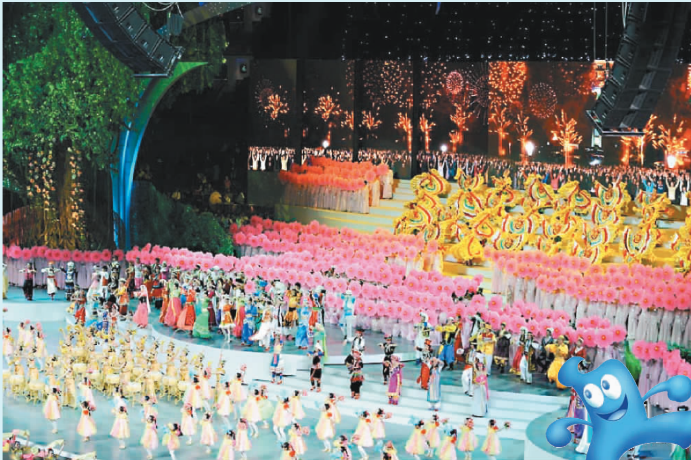
2010年上海世博會開幕式文藝表演，四月三十日在上海世博文化中心舉行。

【本報綜合外電報導】備受全球矚目的二〇一〇年上海世界博覽會，昨晚八時開幕，五月一日至十月三十一日開放參觀，預計半年內，將有超過七千萬人湧入。這次上海世博會硬體軟體，打破歷屆紀錄，不僅讓觀眾看到各國科技及人類文明，也看到上海驚人的發展。 根據報導，這次盛會至少將為已有一百五十九年歷史的世博會，創造十項空前的紀錄： 一、規模最大：共有一百八十九國、五十七個國際組織確定參展，刷新二〇〇〇年德國漢諾威世博會保持的一七七個國家和組織參展的紀錄。 二、出席政要最多：已確定參觀上海世博會的副總統以上政要達一百零二批，數十位外國國家元首、政要以及重要貴賓出席開幕式。 三、展覽園區面積最大：上海世博園區總面積達五點二八平方公里，是歷屆世博會之最。其中浦東三點九三平方公里，浦西一點三五平方公里。外國自建展館數量四十二個，也是歷屆最多。 四、活動最多：平均每天一百場參展的國家中，已有一百五十九國申報二百三十七個國家館日活動，確認參展的國際組織中，有三十個申報十五個榮譽日活動。此外，文藝活動超過八百場，演出總場次達一萬七千多場，平均每天演出一百場。 五、義工最多：世博會期間，將有七萬名園區義工、十三萬城市站務義工、近二百萬名城市文明義工，活躍在世博園區內外與上海全市，人數超過北京奧運。 六、媒體人數最多：報導本屆世博會的中外媒體記者達一萬四千人，其中海外媒體人員超過三千四百人，是歷屆最多。 七、主辦城市的人口最多：上海目前常住人口已達二千二百萬人，外來人口就有八百萬人。 八、參展援助資金最龐大：「世博會不是已開發國家的專利」，本屆世博會設立了一億美元的專項基金，資助發展中國家參展，是歷屆最多。 九、面臨的挑戰最多：上海世博會的場館面積是歷史上最大，參與者、來訪者人數也是有史以來最高。因此，上海世博會在交通、人員安頓，以及如何提供一個舒適的環境等各方面，都面臨極大的挑戰。上海市規畫世博園區內共十八條交通路線，地鐵每小時可輸運四點七萬人、公車最短三十八秒一班，水上交通也規畫十二條航線。 十、最創新積極：上海世博會有兩大創舉，其一，首次以「城市」作為展覽主題的展區；其二，在舉辦實體世博會的同時，並推出網上世博會，充分利用和借助全球互聯網的優勢，使得上海世博會成爲「永不落幕的世博會」。(相關新聞詳看四版)