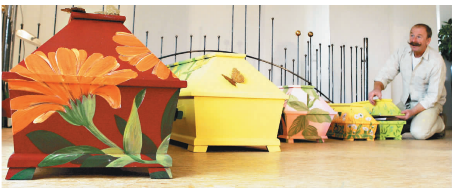
彩繪棺木 美美入土

權勢靠不住，因為「強中還有強中手」。你當了縣長，上有省長；你作省長，遇到國家領導人，你怎麼辦呢？所以「人外有人，天外有天」，有權勢的人呼風喚雨，一個意見，說一句話，都要人聽命服從，但是「爬得高，跌得重」，從高處的權位上跌下來的人士，自古以來不知凡幾。歷史上，秦始皇曾經擁有最大的權勢，而今何在？王莽、高力士、魏忠賢等，也都曾經位高權重，顯赫一時，今又如何？所以權勢不但不可敬，而且可怕，有權勢的人能夠擁有平等心，才是安全之道。 四、威勢——就是「以威伏人」：威勢，從好的方面來講，是以威德服人，如果往壞的方面發展，就是以威勢欺壓人。常見有一些人，出門時總有很多隨從為他助長威勢，也有的人以乘坐貴重的交通工具來增加自己的威勢，乃至有的人用財富、用名位來展現威勢。其實，一個人最重要的，還是用道德、結緣來讓人尊重，所謂「不怒而威」、「不威而嚴」，能以「威德服人」，才能真正贏得人心。 人不能沒有架勢，但是人應該發展自己好的架勢，例如慈悲的架勢、智慧的架勢、道德的架勢、人緣的架勢，尤其「平常」的架勢最能長久。