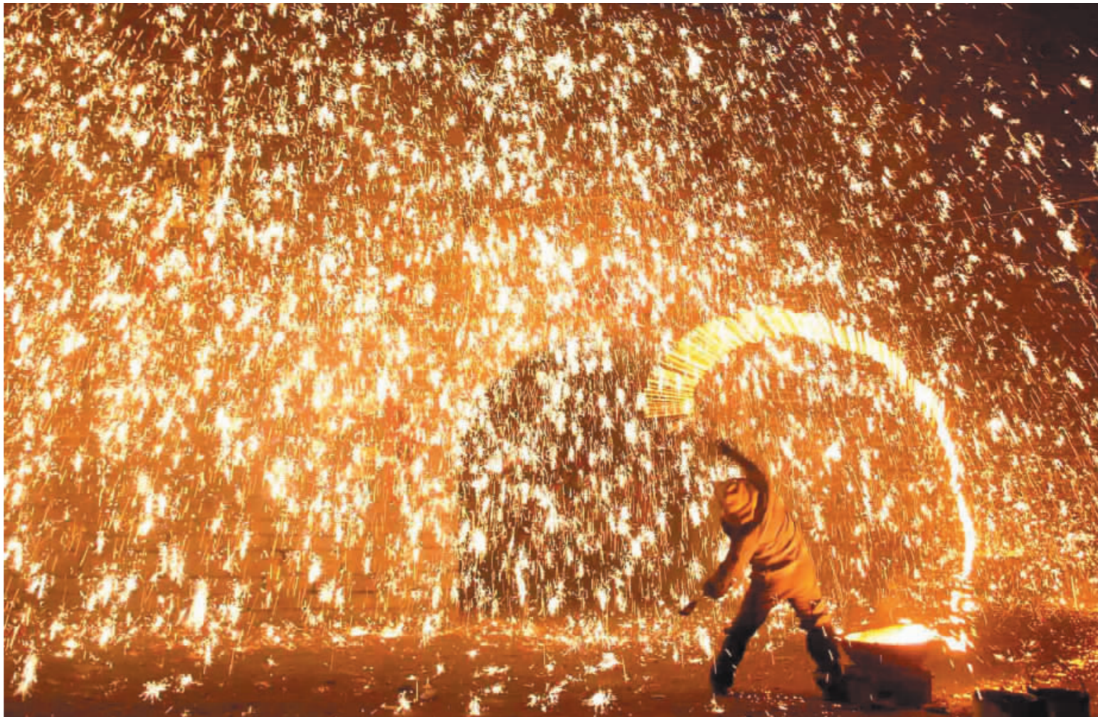
河北元宵打樹花 一脈相傳300年

中國大陸河北省蔚縣十一日舉行傳統民俗表演「打樹花」。打樹花是極具蔚縣地方特色的元宵節活動，相傳已有三百多年歷史。打樹花時，藝者反穿羊皮襖、頭戴濕氈帽，將廢鐵熔成的鐵水裝入特製的容器內，用在水中浸泡了三天的柳木勺子，將鐵水一勺勺潑灑在古老的城牆上，迸發出絢麗多彩的火花。