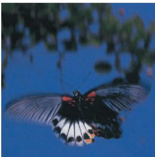
雙大屯姬深山蛾形蟲的雌蟲，黃腳深山蛾形蟲的雌蟲也不到十隻，可說是草原上的生物謎題。

自然生態教育基金會表示，「發現台灣」影展的主軸是台灣山區的蝴蝶和昆蟲。例如，研究人員在南投發現的一隻大鳳蝶「陰陽蝶」，黑色的左翅較小，是明顯的雌蝶外觀，但右翅比較大，後翅處呈整片的白色，屬於雌蝶特徵，研究人員進一步研究後又發現，這隻「陰陽蝶」的生殖器官爲雌蝶，而陰陽蝶的發生率只有百分之十。