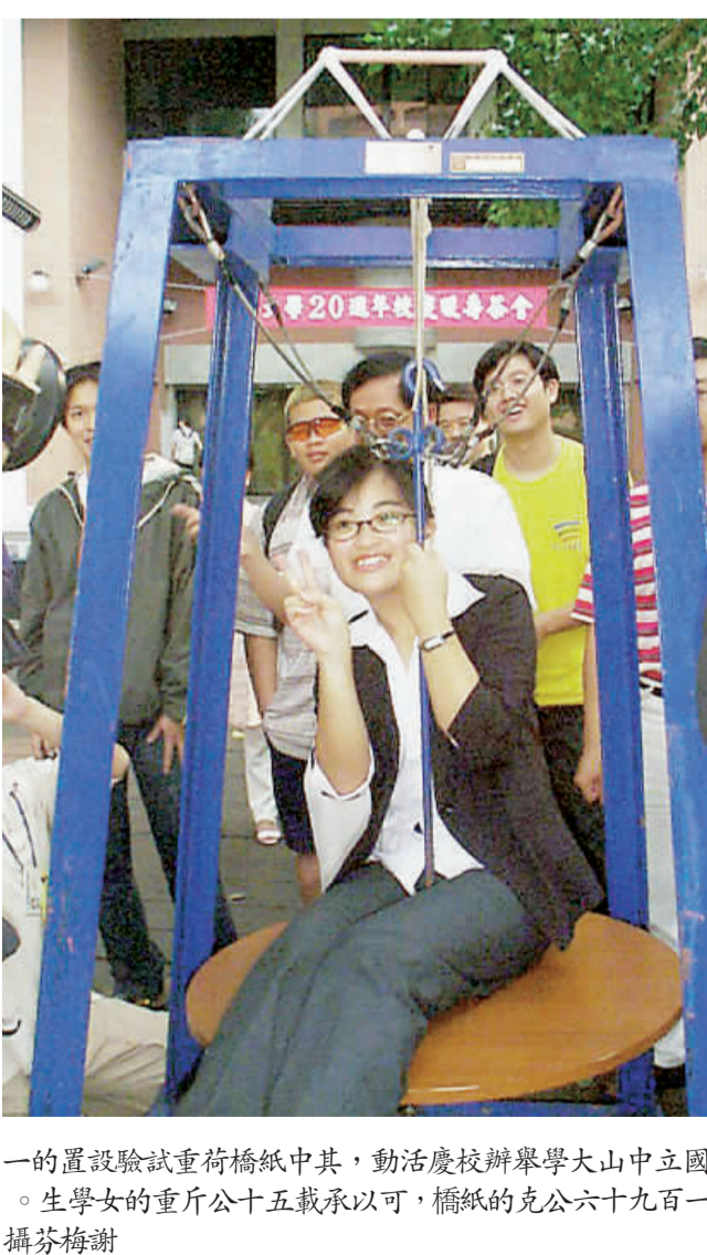
一置設驗試重荷橋紙中其，動活慶校辦學舉大中山立國。生學女的重斤公十五載承以可，橋紙的克公六十九百一座攝芬梅謝

196公克紙橋 載重?公斤 中山大學荷重比賽 要挑戰全國紀錄 【本報高雄訊】國立中山大學七日爲十一月登場的校慶先系學生利用課堂所學有關結構與靜力的原理，製作紙橋，每座由中山大學學生製作的一百九十六公克的紙橋，可以承載五十公斤重的女學生。 中山大學十一日起舉辦一連串的校慶活動，其中海工系紙橋荷重挑戰全國紀錄，一座由桿件(用紙捲成的實心或空心的棍子)與紙帶(平面的紙)所組成的紙橋，要能承受重達數百倍於其自重之重量。七十六公克，甚至可負載五十公斤的女學生，令中山大學教授陳邦富說，這