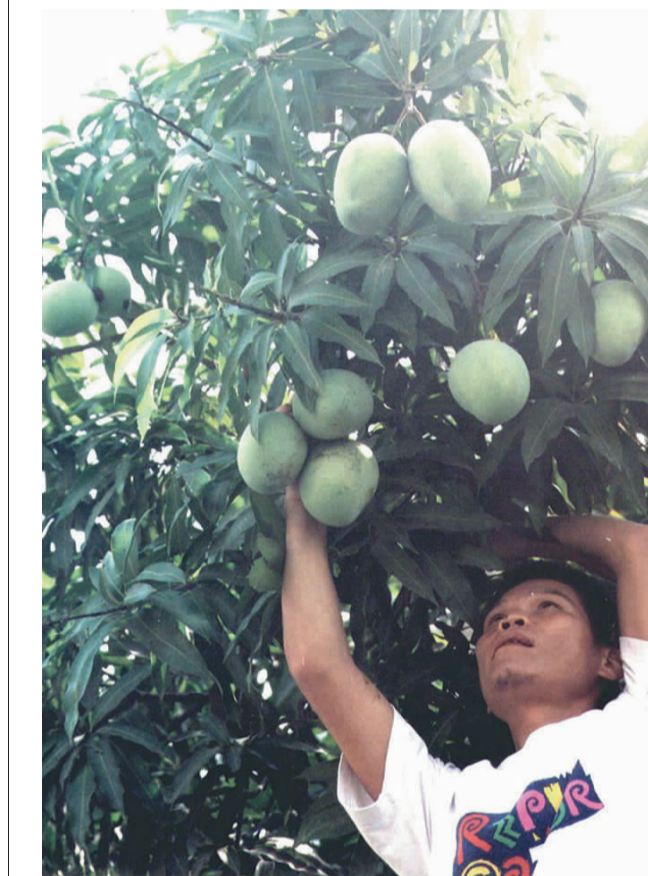
果芒土探兩的種所家人姓張戶一路水員鎮林員縣化彰。奇稱衆民，合不序時於由，果芒大碩出結近最，樹

【本報訊】員林鎮員水路張姓鎮民表示，家門前的兩棵土芒果樹，種了十多年，每年都在春夏之交開花結果，今年結果也正當，不料在六月間才結完果，卻又開花，現在長成的芒果遠比土芒果大，如愛文芒果般大小，其中一棵只長了一顆，另一棵則長了十八顆。 在秋末冬初，長出芒果，甚至「變種」成實更大的愛文芒果，不僅張姓住戶想不透，鄰居及過往路人也噴噴稱奇，懷疑是九二一大地震後造成的自然「異象」。 行政院農委會中區農業改良場果樹研究室人員表示，果樹亂了時序生長的情形不算少見，除了可以技術調節外，也常因乾旱後再下雨，改變了花果生長條件，或因枝條折斷、修剪等因素刺激，也有開花結果可能，像過去櫻花亂了時序也是相同原因。 至於土芒果果得較大的原因，應與結果較少，養分較為充分有關。